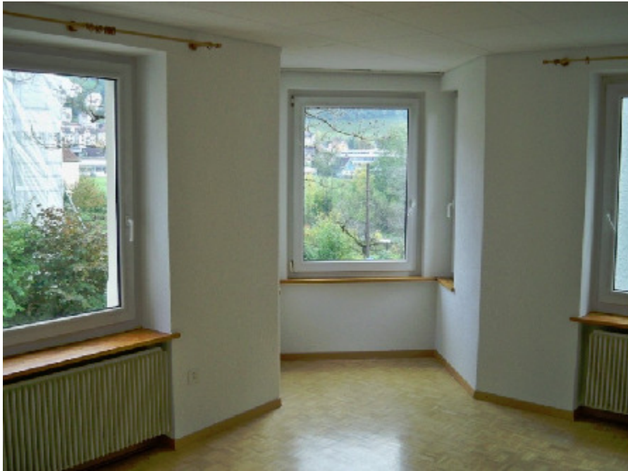
Erker von Innen nach Außen, Dürrenmattstr. 38, 9000 St. Gallen