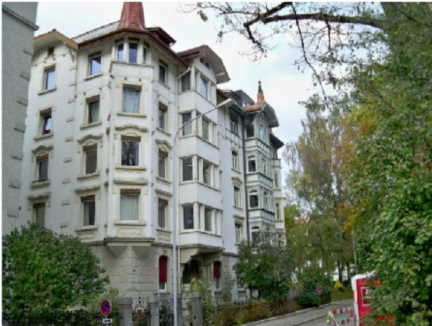
Erker von Außen nach Innen, Dürrenmattstr. 38, 9000 St. Gallen