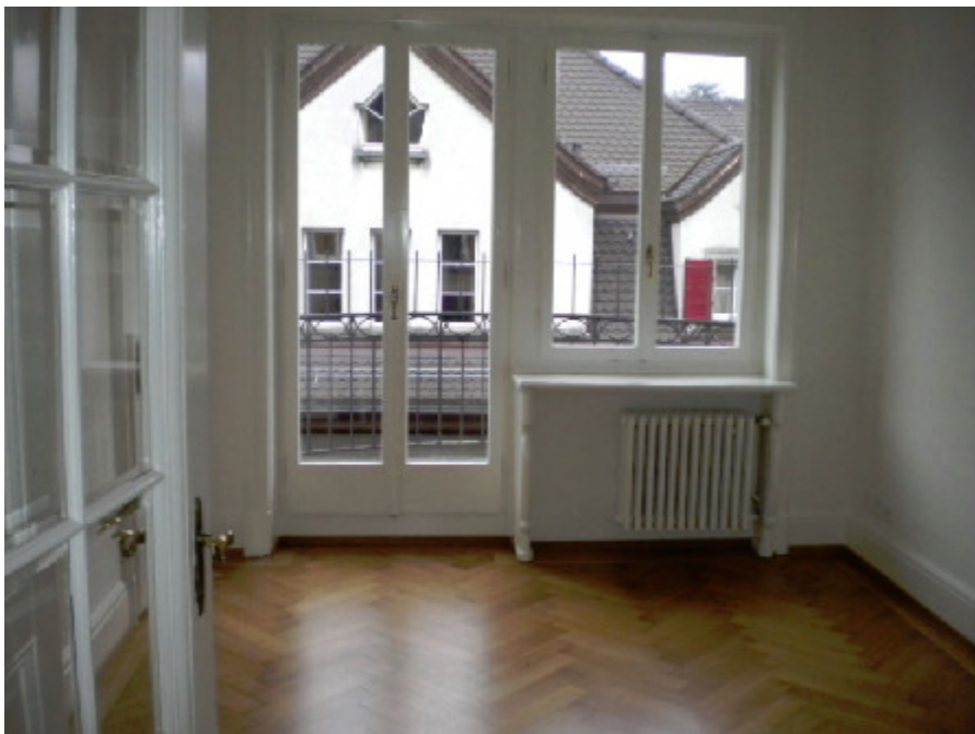
Lavaterstr. 101, 8002 Zürich

Im folgenden Beispiel wurde der ursprüngliche Radiatorkasten durch eine Kombination aus neuem Zentralheizungskörper, Fensterbrett und seitlichen Streben ersetzt: