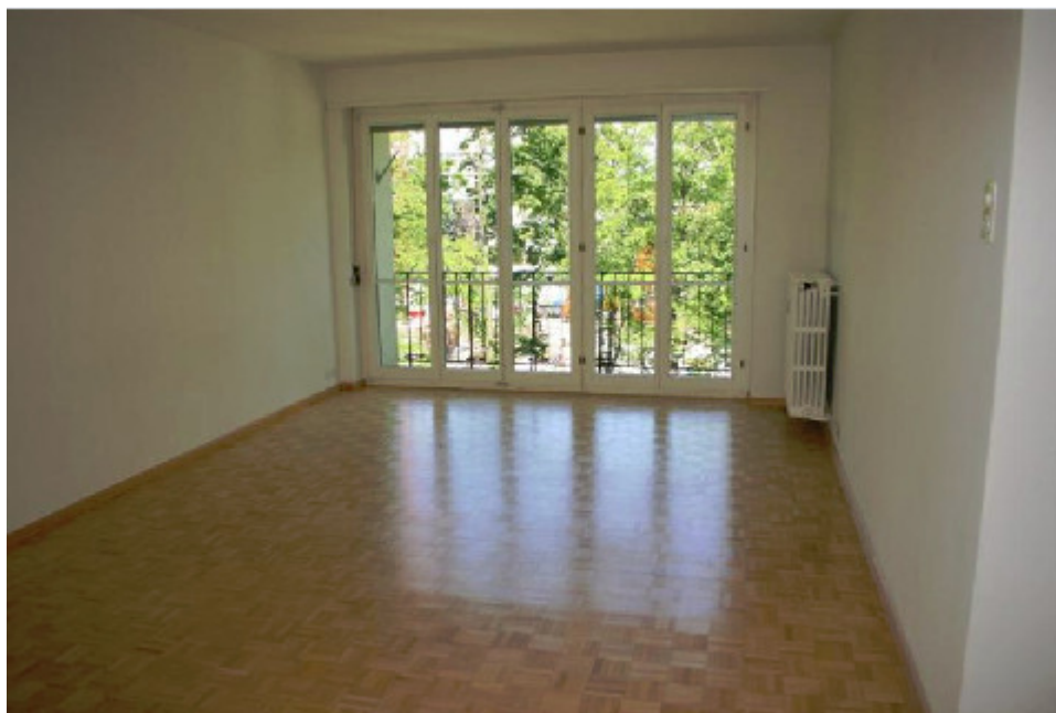
Seevogelstr. 142, 4052 Basel (1949)

In der funktionalen Architektur gibt es keine Radiatorkästen und damit auch keine iconisch-selbstähnlichen Abbildungen zwischen Innen und Außen mehr: