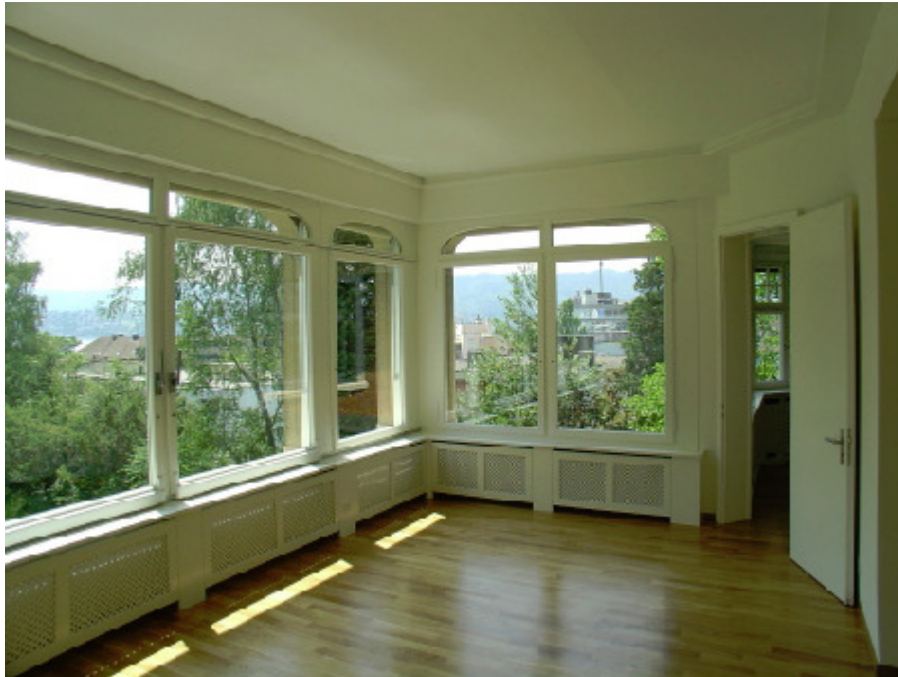
Radiatorkästen in geschlossener Veranda, Arosastr. 7, 8008 Zürich

Bei der Abbildung einer konkaven auf eine konvexe Funktion wird zuerst die Veranda als Innen (1) aus dem Außen extrahiert, bevor in diesem neu geschaffenen Innen (1) durch Extraktion ein weiteres Innen (2) erzeugt werden kann: