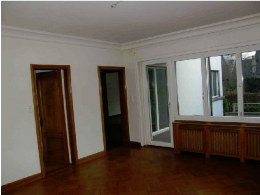
Radiatorenkasten, Moussonstr. 6, 8044 Zürich (1934)

Im folgenden Beispiel wurde der ursprüngliche Radiatorkasten durch eine Kombination aus neuem Zentralheizungskörper, Fensterbrett und seitlichen Streben ersetzt: