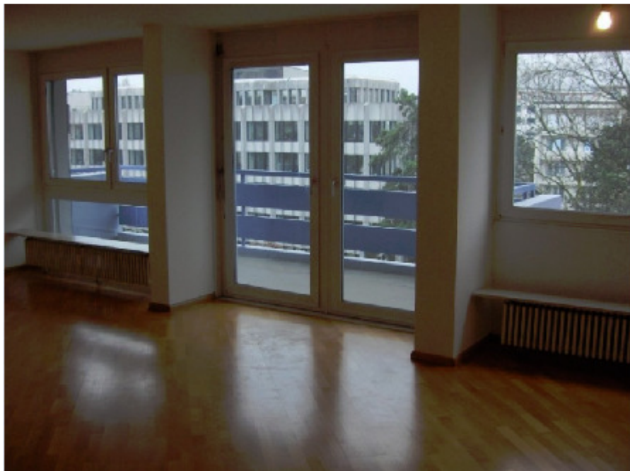
„Meta-Nische“, St. Albananlage 25, 4052 Basel (1962)