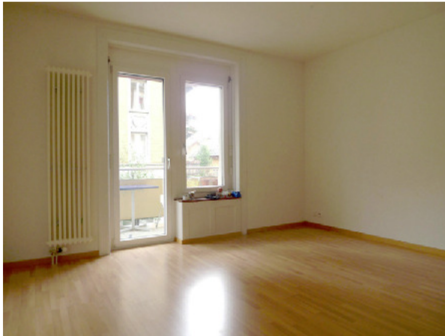
Landenbergstrasse, 8037 Zürich (1900)

Untenstehend wurde der alte Radiatorkasten zugeschlossen. Der neue Heizungskörper befindet sich links von der Balkontür: